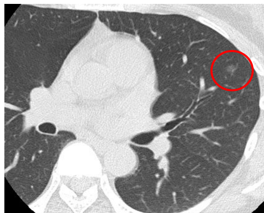
早期の肺がん（赤丸内の淡い陰影）